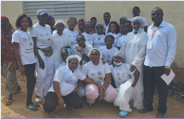
Don de médicaments à la maternité de Koumassi Divo

La lutte contre les cancers du sein, des ovaires et du col de l'utérus, tous trois principaux responsables de décès en Afrique, est inscrite dans le mandat de la Fondation Atef OMAIS.