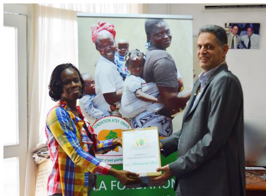
Don de médicaments à la maternité de Koumassi Divo

médicaments essentiels d'une valeur de 3 300 000 FCFA dans 6 de nos maternités réhabilitées. La mise à disposition de deux véhicules (un véhicule de type 4X4 pour les missions et un autre véhicule de liaison) nous ont permis d'effectuer des visites semestrielles dans 10 établissements. Celle de Kanzra n'a pu être visitée à ce jour car difficile d'accès. Ces établissements pupilles se sont vu aussi doter en équipement. Ce sont les maternités d'Abobo Doumé (suppresseur), l'Hôpital Général de Bingerville (table d'opération) et le centre de santé d'Assinie France (lits, potences, matelas, tables d'accouchement, splits).